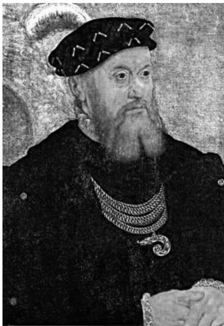
Maleri af kong Christian III