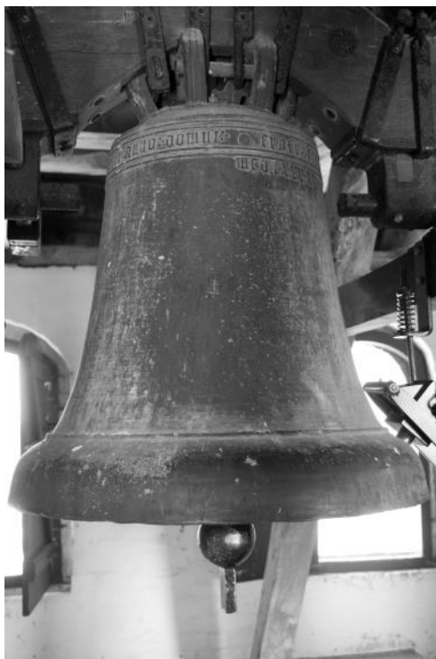
Øm Klosters klokke

Fåborg Helligånds-kloster blev grundlagt så sent som i 1477. Klosterbygningerne blev nedrevet i