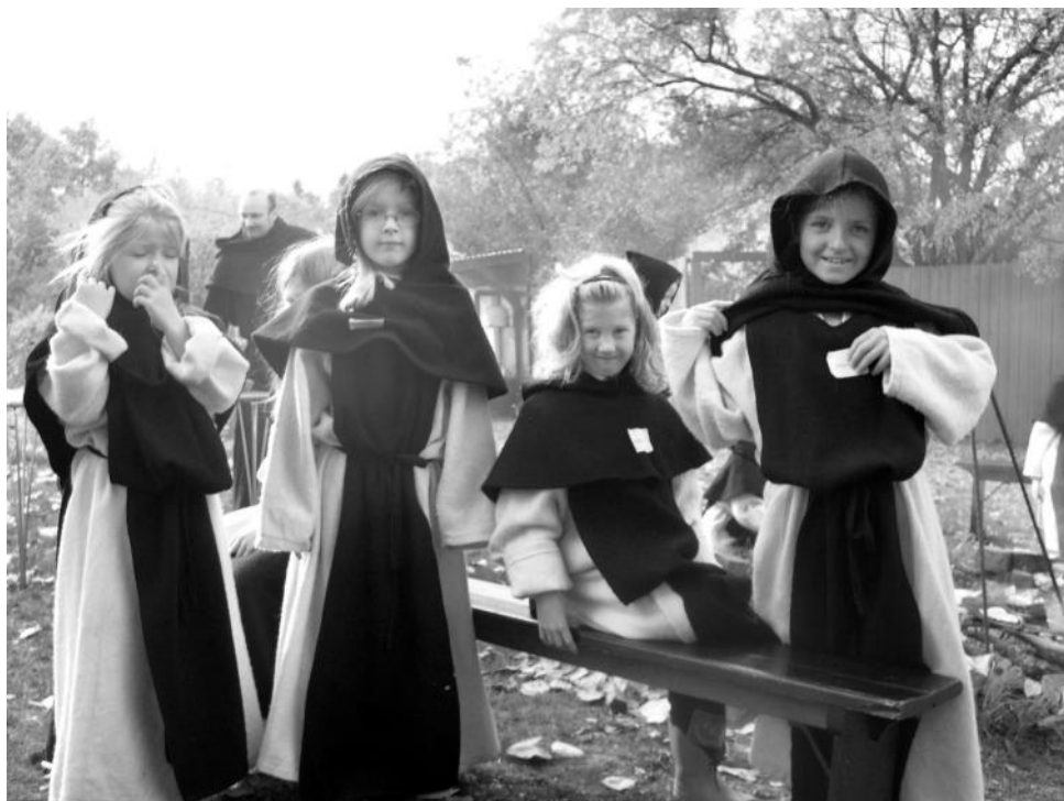
Munke for en dag