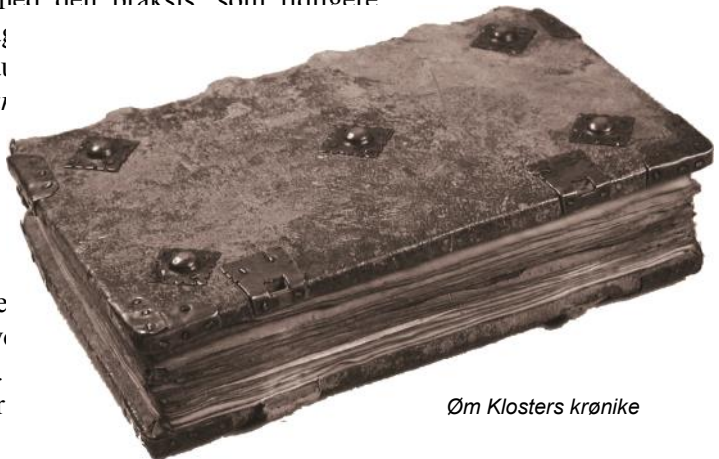
Øm Klosters krønike

var blevet grundlag for moderkloster, Cîteaux. Exordium parvum (Den lille begyndelse), der beskrev hvordan Cîteaux blev grundlagt, blev således model for andre klostre redegørelser om hvordan de blev oprettet. man sammenligner