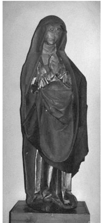
Mariafiguren i Tirstrup Kirke

Klosteranlægget står delvis intakt under herregårdens mure, dog er alle mure omsatte i tidens løb, mens grundstenene overalt er de samme. Østfløjen er oprindeligt i to stokværk, som de andre fløje, og uden tårne, og efter ombygningen i 1860 står de middelalderlige mure kun i første stokværk. I denne fløj er en overhvelvet middelaldersal bevaret. Hvælvene bæres af en centralsøjle der er firkantet. Døråbningen i denne sal er den eneste fuldt bevarede i anlægget. Det næste rum er en toskibet hvælvet pillosal, hvorfra en dør førte ud til klostergården. Resterne af et vindue viste en bred spidsbuet form. Gulvene lå ca. en meter under de nuværende. Om portgenemførelsen stammer fra klostertiden ved man ikke. Nederst i fløjen ligger en toskibet hvælvet pillosal med seks hvælvinger.